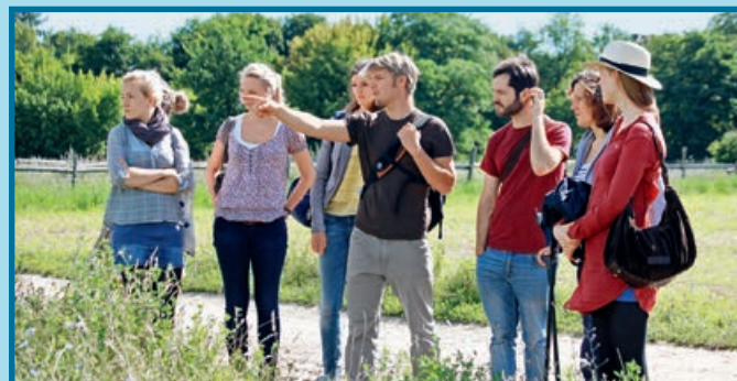
Exkursion zum Versuchsgelände der Landwirtschaftlich-Gärtnerischen Fakultät der Humboldt-Universität zu Berlin, Thema: Wissenschaftliche Erläuterungen zu den Klimaauswirkungen im Sauerkirschen-Anbau.

Zwischen dem ersten und zweiten Block befasst du dich weiter mit deiner Forschungsfrage, indem du dir Hintergrundwissen aneignest, dich mit den notwendigen Methoden befasst und dich im Team und im Austausch mit den Mentoren so vorbereitest, dass du im Sommer gleich in die Experimentierphase zur Beantwortung deiner Fragestellung gehen kannst. Während der Vorbereitungsphase wirst du von deinen Mentoren der Partneruniversitäten sowie vom WWF Deutschland begleitet.